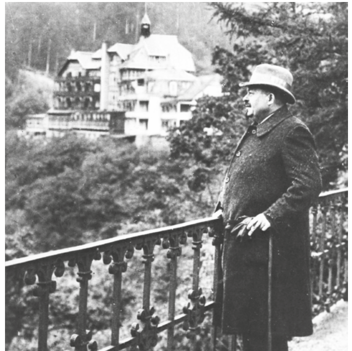
Das bekannte Foto mit Reichspräsident Friedrich Ebert in Schwarzburg, im Hintergrund das Hotel Weißer Hirsch, von dem aus Ebert während seines Urlaubs die Regierungsgeschäfte leitete.

Auf dem gesamten Festgelände finden Sie Schauspieler/-innen in historischen Kostümen. Zeughaus und Schaubauausstellung im Hauptgebäude sind geöffnet. Es gibt Bücher über Friedrich Ebert in Weimar und Schwarzburg (im Kaisersaal und im Shop) sowie die Ausstellung „Nur hundert Jahre - Die Aktualität von Frauenwahlrecht und Frauenpolitik“ im Kaisersaal. Verpflegungsstände und Angebote für Kinder runden das Festprogramm ab.