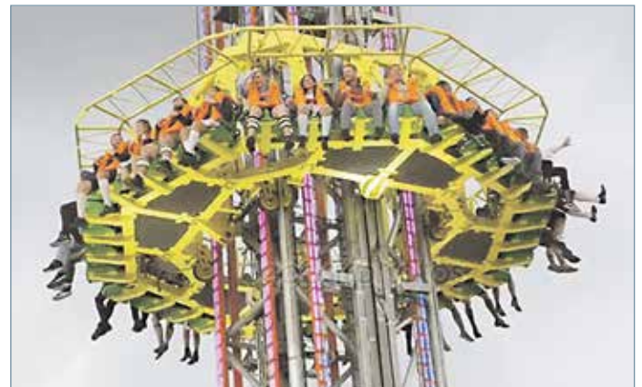
Sensationelle Attraktion des Jahres: Der 80 Meter hohe „Skyfall“ ist der weltweit höchste mobile Freifallturm.

Alle Infos und der tägliche Videoblog „Drehmomente“: www.vogelschiessen-rudolstadt.de