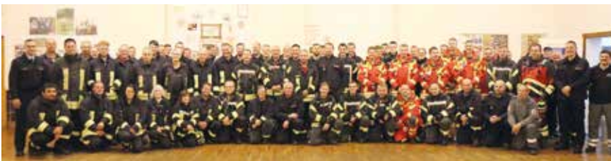
Zum Abschluss im Vereinshaus Schaala: Die Einsatzkräfte nach der Übung.

Einsatzkräfte innerhalb der anvisierten einen Stunde anrückten. Anschließend wurde im kleineren Kreis mit 85 Beteiligten in einer Elementübung das Erkunden, Löschen und Suchen/Retten von Personen am und im Tunnelbauwerk geübt. Am Rettungstollen Mitte war die erste Feuerwehr, nämlich die Feuerwehr Teichröda, bereits zeitnah eingetroffen. Wegen der fehlenden Beleuchtung am Ausgang des Rettungstollens war es dort die erste Aufgabe der Feuerwehren, eine Beleuchtung zu installieren und erste sogenannte Selbstretter zu sammeln. „Mein Respekt und Dank gilt allen Beteiligten, die auch bei dieser Tunnelübung wieder gezeigt haben, dass sie mit Leib und Seele mitmachen und gut vorbereitet sind, Menschen in Not auch unter schwierigen Bedingungen zu helfen“, so Landrat Marko Wolfram.