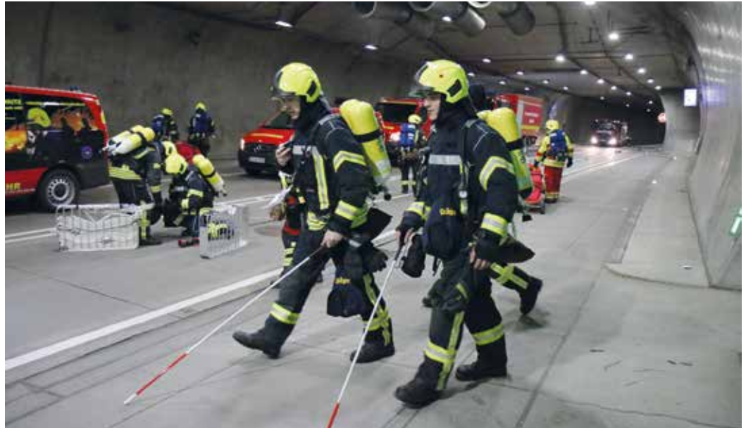
Die Einsatzkräfte an der Ereignisstelle beim zweiten Teil der Elementübung im Tunnel Schaala - Erkunden der Lage, Löschen von Fahrzeugen, Suchen und Retten von Menschen.

Zielstellung war es, die neue Tunnel-einsatztaktik anzuwenden, die ab dem kommenden Jahr im AGAP, dem Alarm- und Gefahrenabwehrplan für den Tunnel Pörzberg, umgesetzt werden soll.