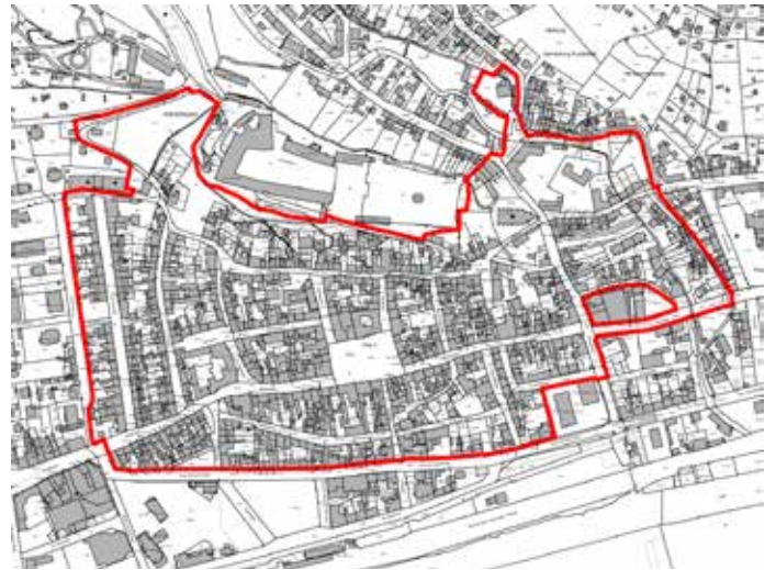
Datengrundlage: Geobasisdaten ©GDI-Th