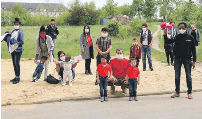
Mit der Aktion „Nähheld_innen“ des Caritas-Freiwilligenzentrums in Saalfeld haben zwölf engagierte Ehrenamtliche Hunderte Masken genäht. Zu den Abnehmern gehören die Saalfelder Tafel, das Caritas Pflegeheim in Rudolstadt, das Familiennest, das Kinderheim BRAWO Land, Seniorenbegegnungsstätten, die katholischen Gemeinden im Landkreis, und ortsansässige Unternehmer oder Privatpersonen sowie auch das Landratsamt mit seiner Gemeinschaftsunterkunft.