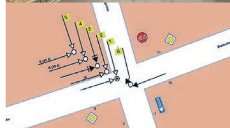
Blick auf die neue Unfallhäufungsstelle in der Saalfelder Breitscheidstraße – und wie das entsprechende Unfalldiagramm in der 3-Jahres-Karte aussieht.