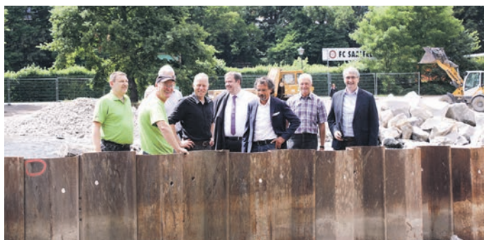
Nach der Einweihung der Sohlgleite in Riegelbauweise am ehemaligen Zeisswehr wurde am ehemaligen Teilewehr mit einem Durchstich der Saale der Startschuss für den zweiten Bauabschnitt dieses Wehrs gegeben. Für die Gäste wurde von der Baufirma eine Art Tribüne inmitten der Baustelle auf der Saale eingerichtet, die durch Spundwände vom Fluss abgetrennt ist.