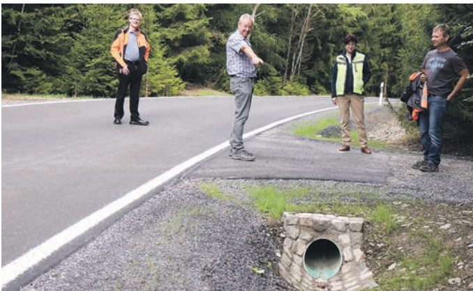
Am 3. August wurde der aktuelle Teilabschnitt der Kreisstraße K 163 nach Roda abgenommen. Baubeginn auf dem 640 Meter langen Teilstück war am 15. Juni, die Verkehrsfreigabe erfolgte bereits am 9. Juli. Erfolgt ist der Einbau einer Asphalttragdeckschicht im Hocheinbau, die Erneuerung der Entwässerungsmulden und Durchlässe. Die ca. 1 Meter breiten Bankette sind mit einem Mineralstoffgemisch aus dem Kamsdorfer Großtagebau befestigt, darauf erfolgte eine Rasensaat.