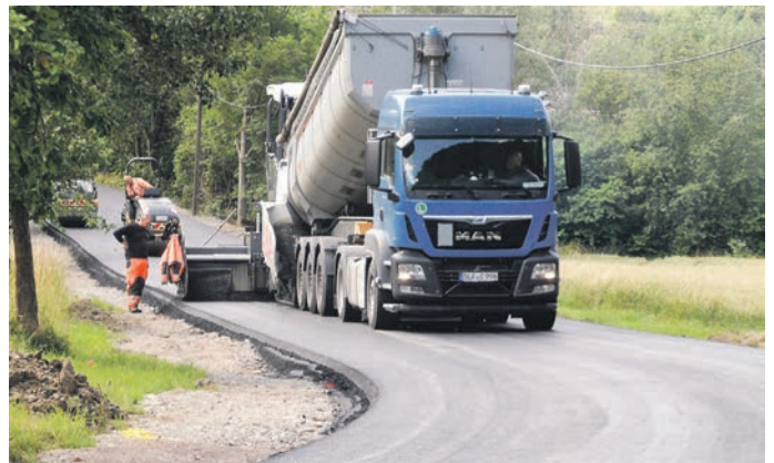
Seit Freitag, 17. Juli, ist die Sanierung und Ertüchtigung der Kreisstraße K 154 vom Abzweig der B 85 nach Weischwitz praktisch abgeschlossen. Damit kann die Straße für die Einwohner von Weischwitz und Breternitz als Umleitungsstrecke für Breternitz genutzt werden, weil die Gemeinde Kaulsdorf ab August in der Ortslage baut. Für die 260 Meter Baulänge bis zur Brücke vor dem Ortseingang wurden 120.000 Euro aus Eigenmitteln des Landkreises verbaut.