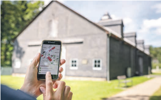
Der Mediaguide der KZ-Gedenkstätte „Laura“ bei Schmiedebach wurde um eine italienische und russische Sprachfassung ergänzt. Damit ist die Führung auf jetzt sechs Sprachen zum kostenfreien Herunterladen auf Android- und Apple-Smartphones sowie als Leihgerät in der Gedenkstätte selbst erhältlich. Der Mediaguide ermöglicht das selbstständige Erkunden der Gedenkstätte. Besucher können sich Informationen, Originalzitate und Erinnerungen ehemaliger Gefangener anhören.