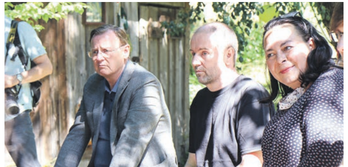
Die erste Station im Landkreis führte den Ministerpräsidenten zum Bahnhofsladen in Rottenbach. In Schwarzburg wurden die Sanierungs- und Nutzungspläne für das Haus Bräutigam durch den gleichnamigen Verein erläutert. In Unterweißbach stellten vor allem Kinder und Jugendliche den Verein Kulturino vor (Bilder unten). Sie haben, teils schon seit mehreren Jahren, an Projekten wie den Englisch Camps teilgenommen.