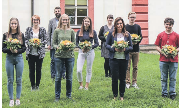
Die acht Neuen im Landratsamt. Sie beginnen die Ausbildung zum Fachinformatiker, als Fachangestellte für Medien und Informationsdienste, als Verwaltungsfachangestellte sowie die Beamtenlaufbahn für den gehobenen nicht-technischen Verwaltungsdienst.