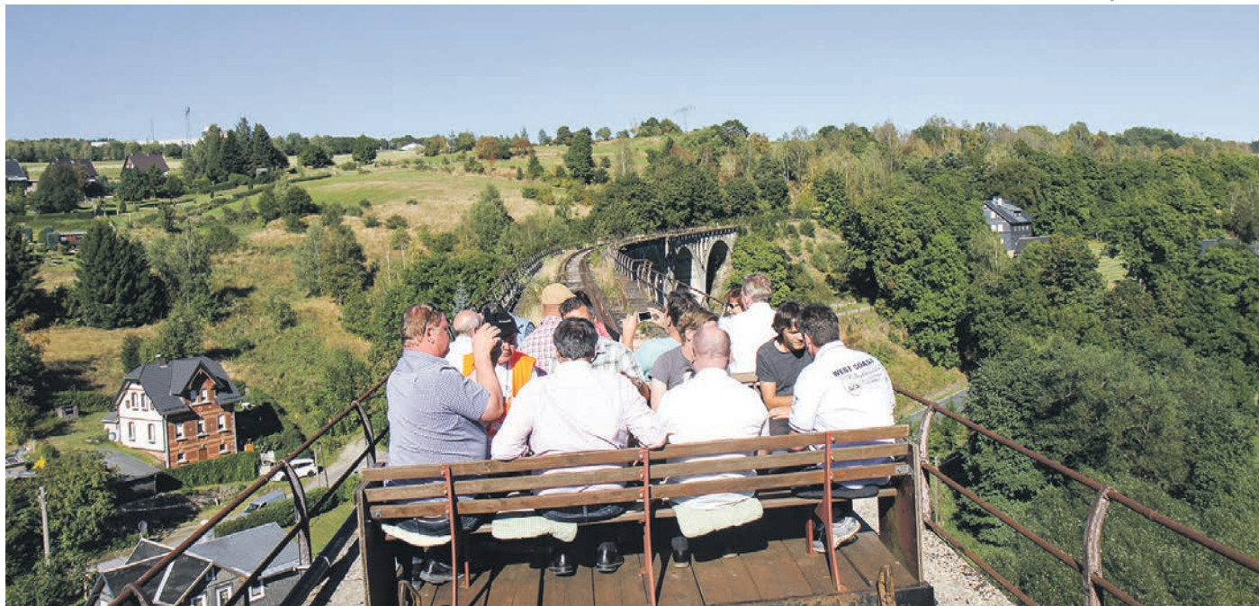
Die Max-und-Moritz-Bahn zwischen Probstzella und Ernstthal ist für Touristen wegen der grandiosen Ausblicke und der spektakulären Viadukte attraktiv. 2016 befuhr der Kreisentwicklungsausschuss die Strecke im Rahmen einer Ausschusssitzung. Für die volle Reaktivierung müsste auch der Güterverkehr auf die Schienenstrecke zurückkehren.