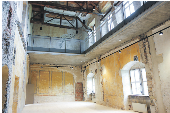
Der Emporensaal entstand durch die Abrissarbeiten in den 1940er Jahren. Er ist jetzt erstmals wieder nutzbar.