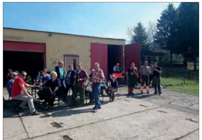
Nach einem sehr intensiven Arbeitseinsatz trafen sich 30 Teilnehmer auf dem Feuerwehrgelände bei Bratwurst und Bier zur Auswertung.

Wir bedanken uns bei allen Arbeitswilligen für ihre Teilnahme . FF Unterwirschbach und Feuerwehrverein Unterwirschbach e.V.