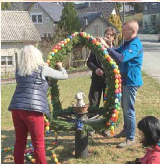
Blumen und Dekoration schmücken wieder den Dorfmittelpunkt.