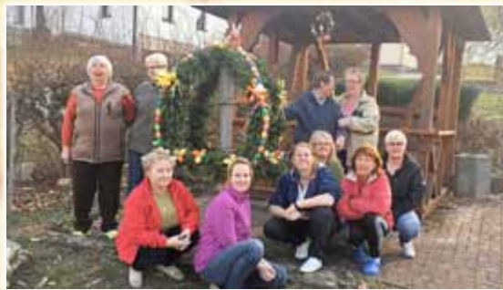
Osterkrone in Wittmannsgereuth