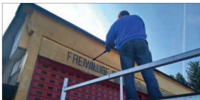
Säubern der Fassade der Fahrzeughalle