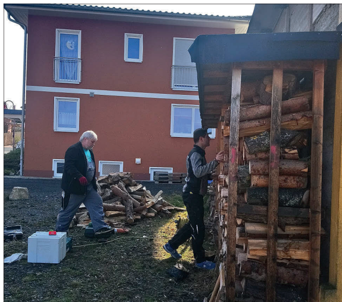
Instandsetzungsarbeiten am Holzregal