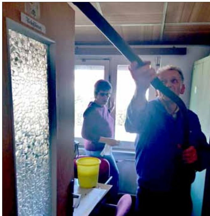
Grundreinigung im Schulungsgebäude mit Fenster putzen und Gardinen waschen

Seit 2010 hat der Feuerwehrverein Unterwirbach e.V. den Frühjahrsputz in seinem Arbeitsplan stehen. Hierbei werden hauptsächlich Arbeiten im Bereich des Feuerwehrgeländes ausgeführt, aber auch im Ortsbereich gibt es Aktivitäten. Auch in diesem Jahr stand der Arbeitseinsatz auf dem Plan, da wir aber die Zeit bis zur Aktion „Saalfeld putzt sich“ nicht abwarten konnten, fand unser Subbotnik schon am 30.03.2019 statt. Hierbei wurden folgende Arbeiten durchgeführt: