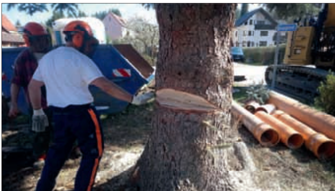
Baumfällung im Bereich der Festwiese/Sportplatz am Vereinshaus

Bei gutem Wetter und bester Laune traf sich die Dorfgemeinschaft Bernsdorf am 06.04.2019 zum gemeinsamen Frühjahrsputz.