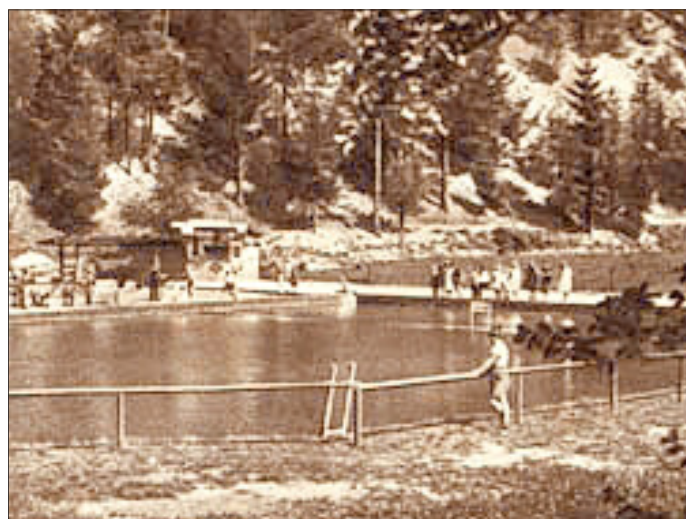
Das Auebad in den 30er Jahren