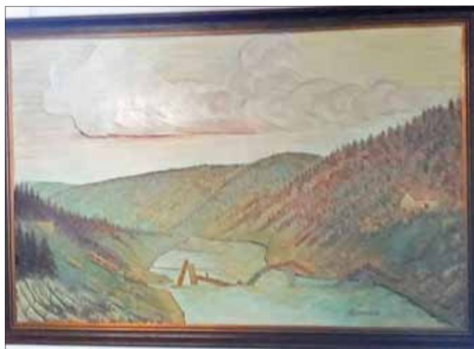
Glück Auf - das Team der Morassina