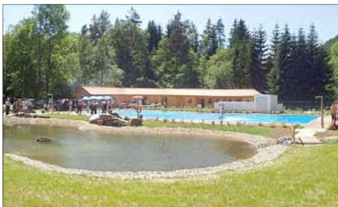
Das Auebad heute