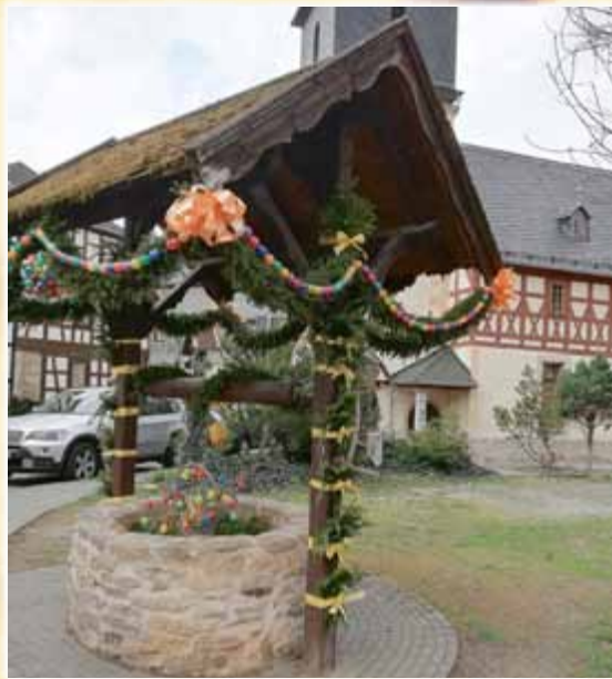
Osterbrunnen in Unterwirschbach