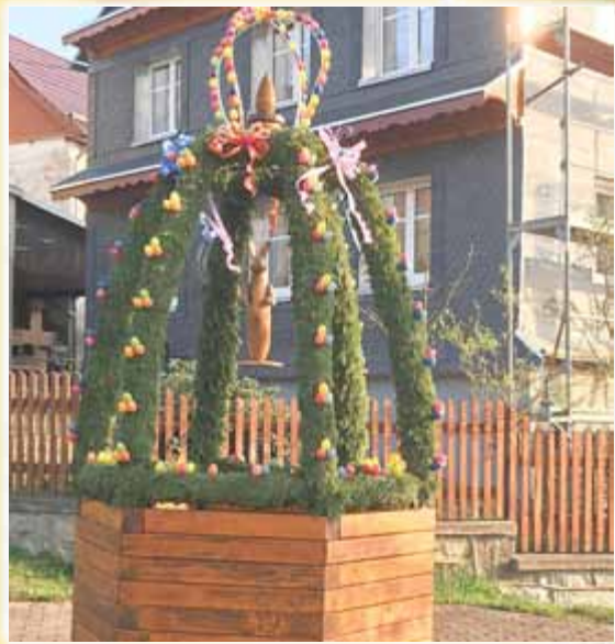
Osterkrone in Dittrichshütte