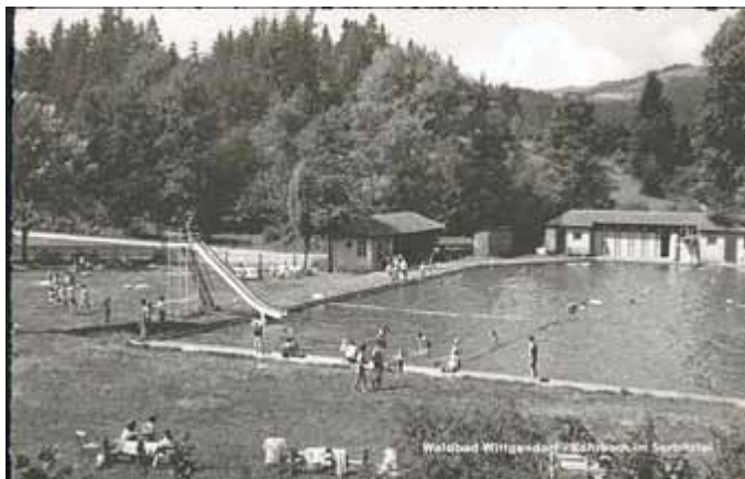
Das Auebad in den 60er Jahren

https://www.facebook.com/auebad.wittgendorf www.feuerwehr-wittgendorf.de