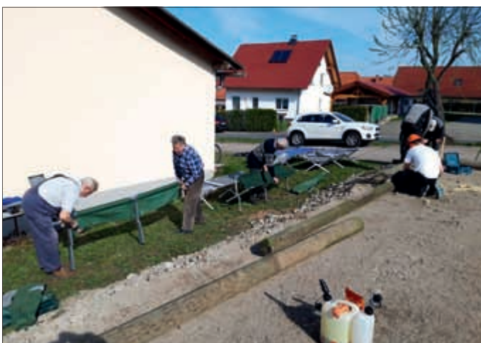
Zustandskontrolle der vereinseigenen Liegen für die Zeltlagerunterbringung unserer Jugendfeuerwehr