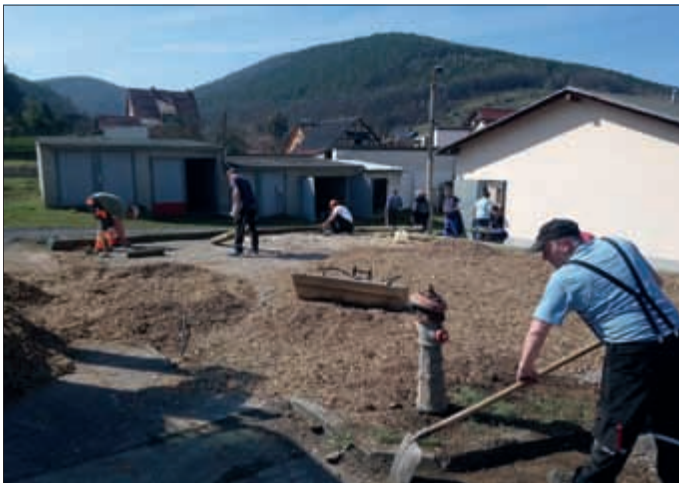
Vorbereiten einer Sitzfläche für die Veranstaltungen auf dem Feuerwehrgelände