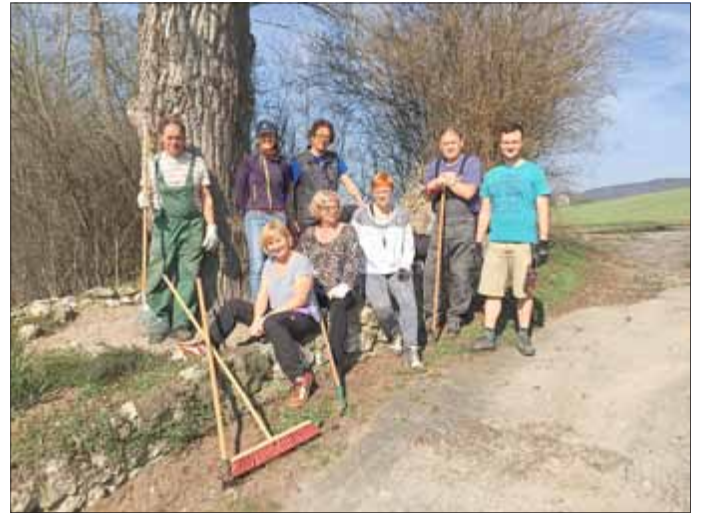
Herrichtung der Grünfläche im Bereich des Ortseinganges aus Richtung Bad Blankenburg