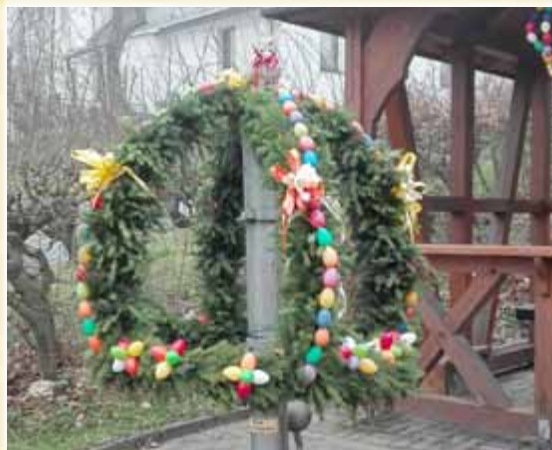
Osterbrunnen in Reichmannsdorf