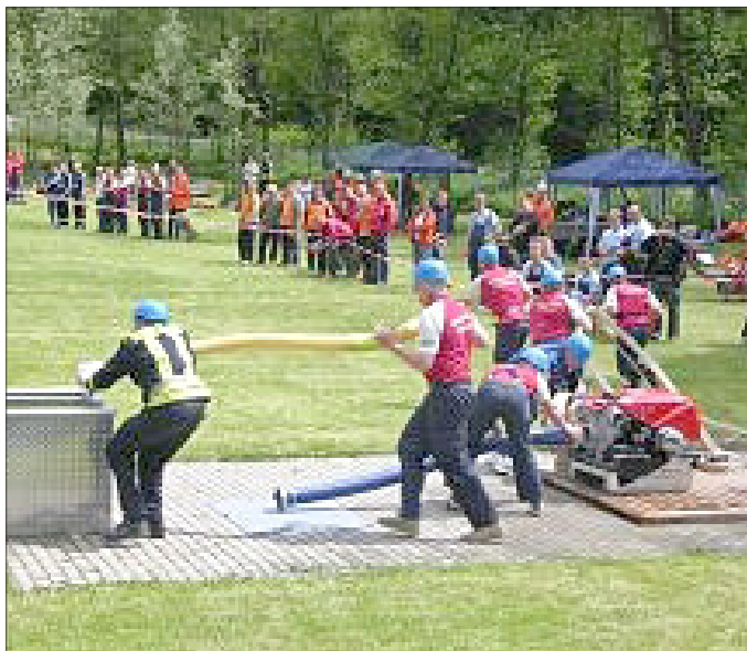
Auebadpokal im Feuerwehr-Löschangriff