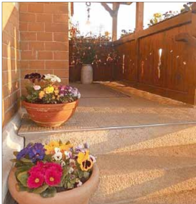
Kindergarten „Hainbergstrolche“ Unterwirbach

an Frau Wenzel für die regelmäßige Versorgung mit Blumen für die Blumenkästen. Es sieht wieder toll aus!