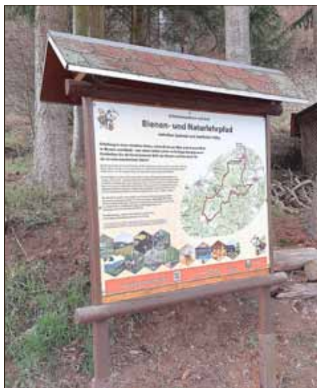
Neue Tafel in Reschwitz, Foto Marion Zapf