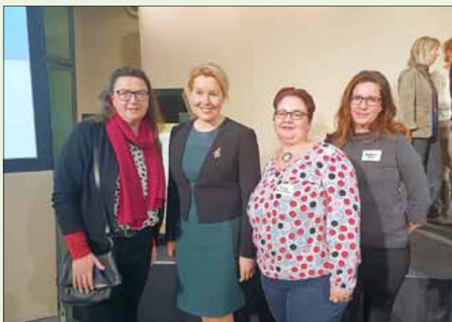
Mit Bundesministerin Dr. Franziska Giffey