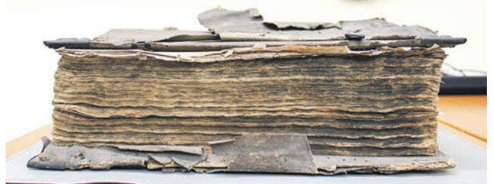
Der Buchblock im Vorderschnitt.

Das Buch wurde vor etwa 20 Jahren in einem Kellerraum des Saalfelder Schlosses aufgefunden; seine Vorgeschichte ist unbekannt. Denkbar ist aber, dass es ursprünglich zur Bibliothek des Herzogs von Sachsen-Saalfeld gehörte – und vielleicht handelt es sich gar um jenes Exemplar, das einst zur liturgischen Ausstattung der Schlosskapelle gehörte.