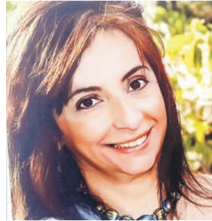
Autorin Yara Wehbi