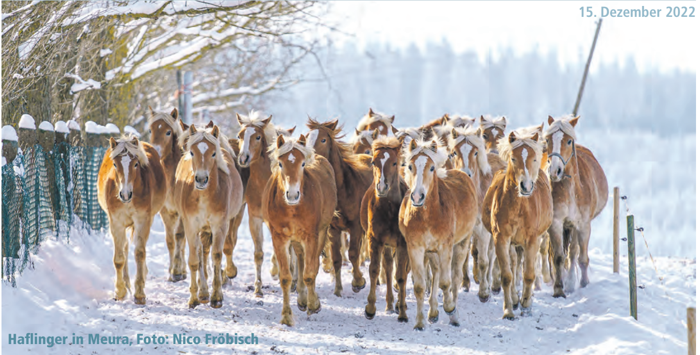
Hafflinger in Meura