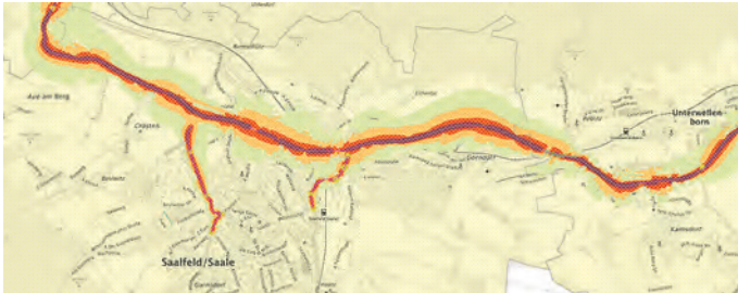
Abb.: Tag/Abend/Nacht-Lärmindex ( L_{Den} ) – Stadt Saalfeld/Saale

Im Rahmen der 4. Stufe der Lärmkartierung gemäß der EU-Umgebungslärmrichtlinie 2002/49/EG wurde die durch den Straßenverkehr an den Hauptverkehrsstraßen in Thüringen verursachte Lärmsituation kartiert.