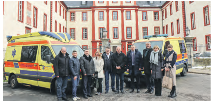
Die Übergabe der Rettungsfahrzeuge fand am 30. Januar vor dem Landratsamt in Saalfeld statt.

Kreisratsvorsitzender Lavriv berichtete über die künftige Verwendung in der Ukraine: „Einer der Wagen wird im Rajon Kalusch unter anderem dafür genutzt, bewegungseingeschränkte Menschen zum Krankenhaus zu bringen, damit diese versorgt werden können. Das andere Auto wird mit Sanitätssoldaten aus Kalusch nach