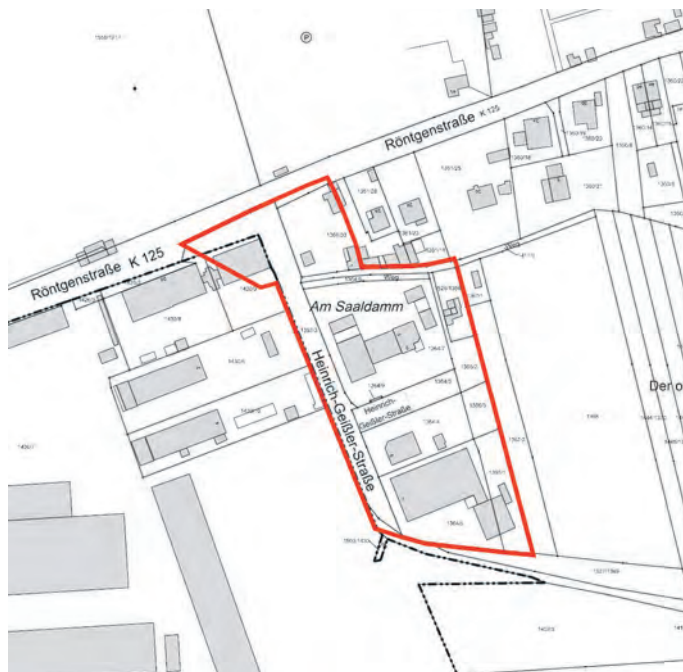
(ohne Maßstab, Datengrundlage © GDI-Th, Alkis, Stand:09/2022)