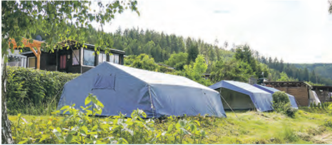
Vier große Zelte stehen auf dem Campingplatz Hopfenmühle für die kostenfreie Nutzung durch Kinder- und Jugendgruppen aus Vereinen im Landkreis zur Verfügung.