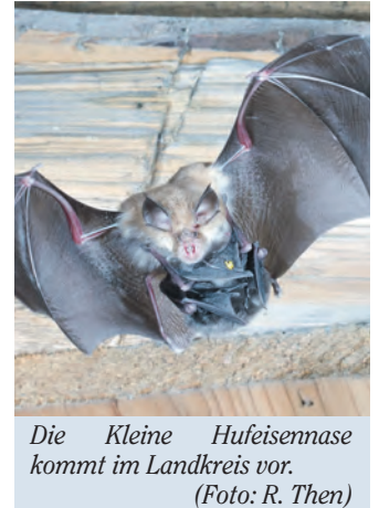
Die Kleine Hufeisennase kommt im Landkreis vor.

Beim nationalen Artenschutz verzeichnete das Sachgebiet 61 Anfragen und Anzeigen von Bürgern oder Institutionen sowie 34 Genehmigungsanträge auf Eingriffe in den Lebensraum geschützter Tierarten. Hierbei handelt es sich vorrangig um Ausnahmegenehmigungen zur Bestandserfassung wildlebender Tiere wie Wildkatzen, Gartenschläfer oder Fledermäuse. Dazu gehört aber auch die Beseitigung von Hornissennestern, die in Kindergärten, Schulen oder Altersheimen eine Gefahr für die Gesundheit darstellen können. Anträge auf Förderung aus dem Kulturlandschaftsprogramm (KULAP) erreichten 2800. Die verschiedenen Vorhaben zur Ent-