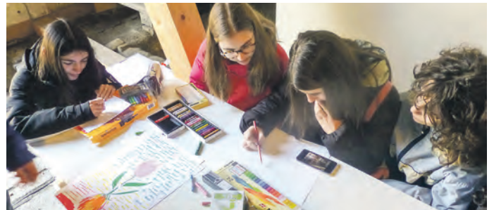
Zum Abschluss des Projekttagess konnten die Jugendlichen aus Katalonien ihre Eindrücke mittels kreativen Werken Ausdruck verleihen. Mit Stiften, Kreiden und Papier schufen sie wunderbare Kunstwerke.