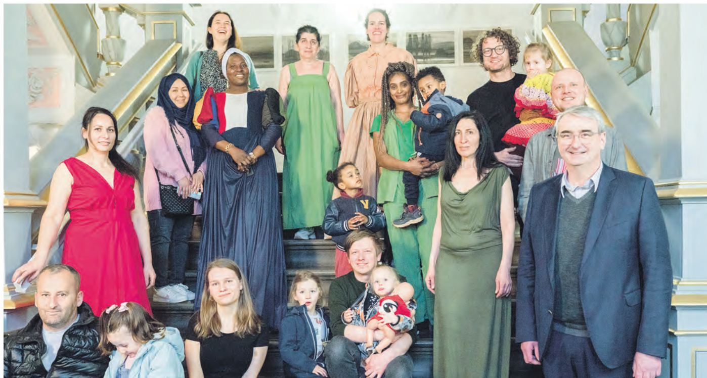
Akteure und Gäste bei der Ausstellungseröffnung von „Beulwitz designt“ in der Galerie im Saalfelder Residenzschloss – vorgeführt wurden einige der im Nähcafé entstandenen, nachhaltigen Kleidungsstücke von den Modellen selbst.