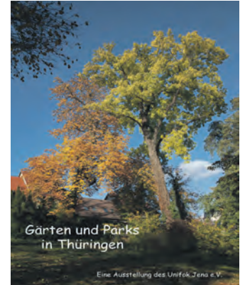
Stadtmuseum Saalfeld 17. Juni bis 24. September 2023

Die Ausstellung wird eröffnet am Samstag, dem 17. Juni 2023, um 11 Uhr im Stadtmuseum Saalfeld. Wir laden hierzu sehr herzlich ein!