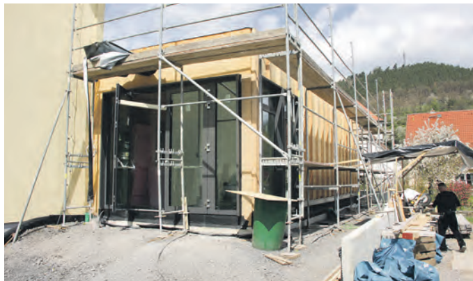
Der Erweiterungsbau der Ganztagschule Uhlstädt ist das größte Hochbauprojekt im Landkreis.

Im Vermögenshaushalt mit einem Volumen von 37,1 Millionen Euro sind allein 18,4 Millionen Euro für den geförderten Breitbandausbau im Landkreis veranschlagt. Für den Vermögenserwerb – dazu zählen Investitionen in Fahrzeuge für die Feuerwehren oder den Katastrophenschutz, technische Anlagen oder Schulausstattung –