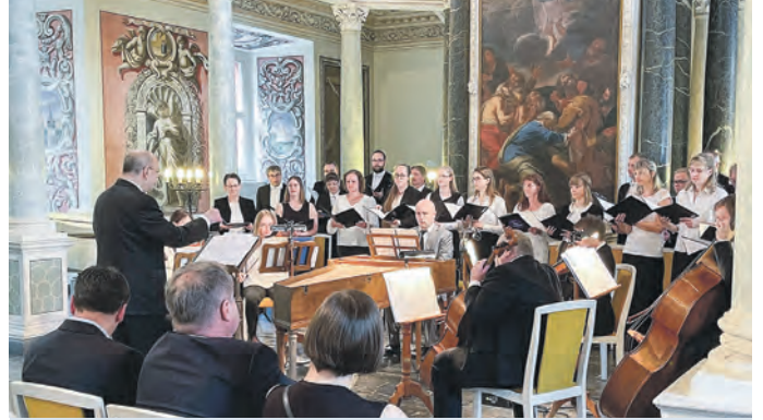
Mit einem Programm mit Werken von Komponisten mit Bezug zu Saalfeld, feierte der Verein Schlosskapelle Saalfeld sein 30-jähriges Bestehen.