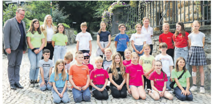
Der Ministerpräsident bei den Nachwuchsimkern von der Marco-Polo-Schule, die vom Imkerverein Saalfeld 1903 betreut werden.

Die 101 Mitglieder betreuen vier Lehrbienenstände, um ihr Wissen an den Nachwuchs weiterzugeben. Der kommt unter anderem von der Marco-Polo-Grundschule in Saalfeld und der Friedrich-Adolf-Richter-Schule in Rudolstadt. Regelmäßig lernen die Schulkinder den Umgang mit Bienen, in Saalfeld besteht die Kooperation mit dem Imkerverein seit 2019, wie Schulleiterin