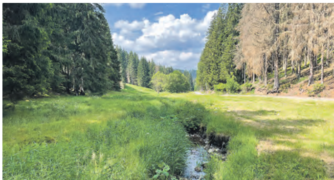
Einen malerischen Anblick bietet das Tal am Lauf der Weißen Schwarza.

Müller und Barbara Leirer vom Sachgebiet Naturschutz im Umweltamt des Landratsamtes. Um das Tal offen zu halten, müssen die Wiesen entlang der Weißen Schwarza regelmäßig landwirtschaftlich genutzt oder gepflegt werden. Damit die Artenvielfalt erhalten bleibt, muss das Mahdgut anschließend entfernt werden. Eine anerkannte zeitgemäße und ökonomische Alternative sind die vierbeinigen „Mähmaschinen“ Pferd und Rind in extensiver Haltung durch landwirtschaftliche Nutzer. Aus Sicht der Naturschutzbehörde ist die extensive Beweidung die günstigste und verträglichste Biotoppflege.