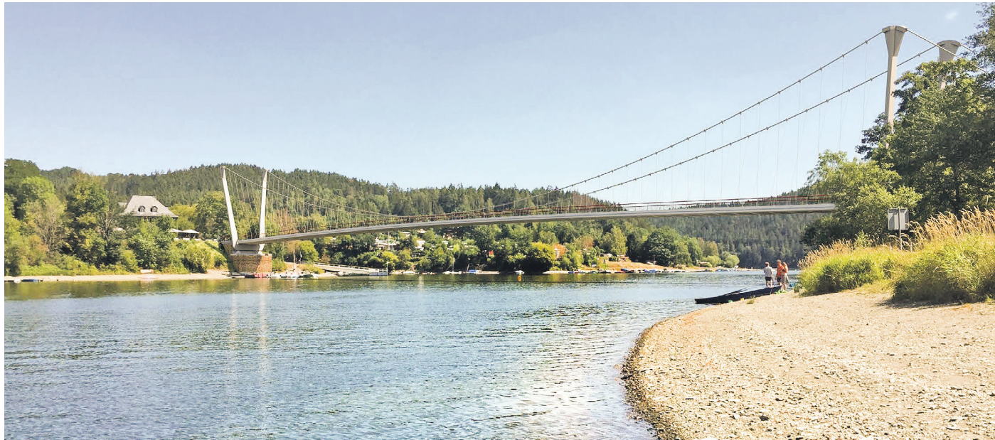
In der überarbeiteten Version fällt die Brücke über den Stausee leichter aus. Statt einer Stabbogenbrücke soll jetzt eine Hängebrücke die Querung sicherstellen. Diese Variante ist modular ausbaubar.